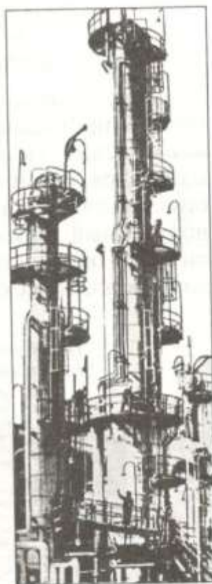
Рис. 14.2. Ректификационная колонна

4. Керосиновая фракция включает углеводороды от \text{C}_{12} до \text{C}_{18} с температурой кипения 180-300^{\circ}\text{C} . Керосин используют как топливо