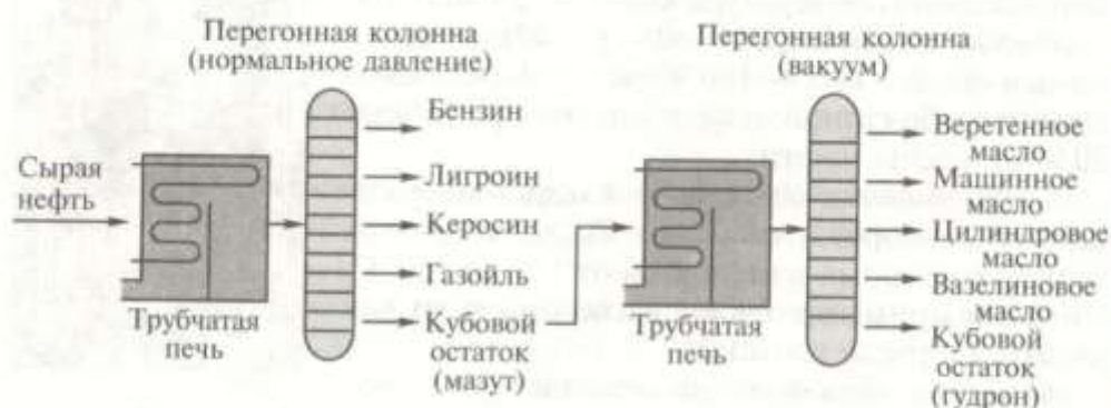
Рис. 14.3. Продукты ректификации нефти и мазута

Если процесс вести в присутствии катализатора ( \text{Al}_2\text{O}_3 , \text{SiO}_2 ), то крекинг называют каталитическим , если без катализатора — термическим . При крекинге нефтепродуктов получают смесь углеводородов бензиновой фракции, содержащую большое количество алкенов, а также газообразные этилен и пропен. Бензин, получаемый термическим крекингом, имеет невысокое качество, он легко окисляется из-за присутствия непредельных углеводородов. Каталитический крекинг сопровождается не только уменьше-